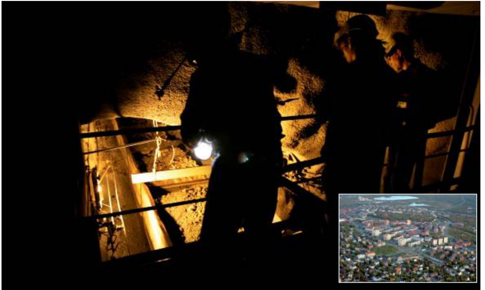
GRÄVER GULD. Australiska gruvföretaget Scandinavian Resources har köpt nio prospekteringsstillstånd i Kiruna på gamla fyndigheter från 1970-talet.

Så har Ågarfrämjandet beskrivit utmaningarna för äganderätten i en debattartikel i Di tidigare. (Di)