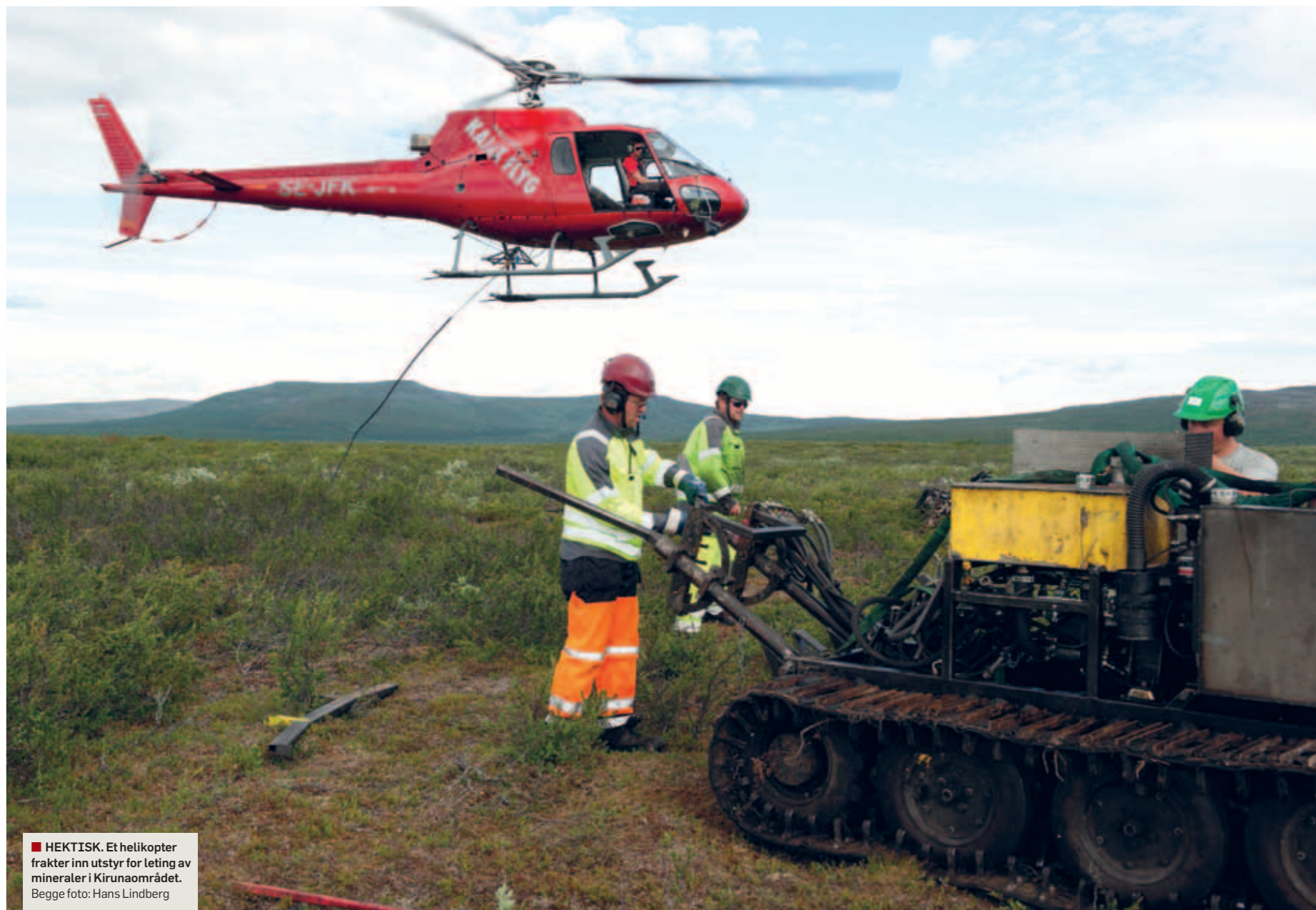
■ HEKTISK. Et helikopter frakter inn utstyr for leting av mineraler i Kirunaområdet.